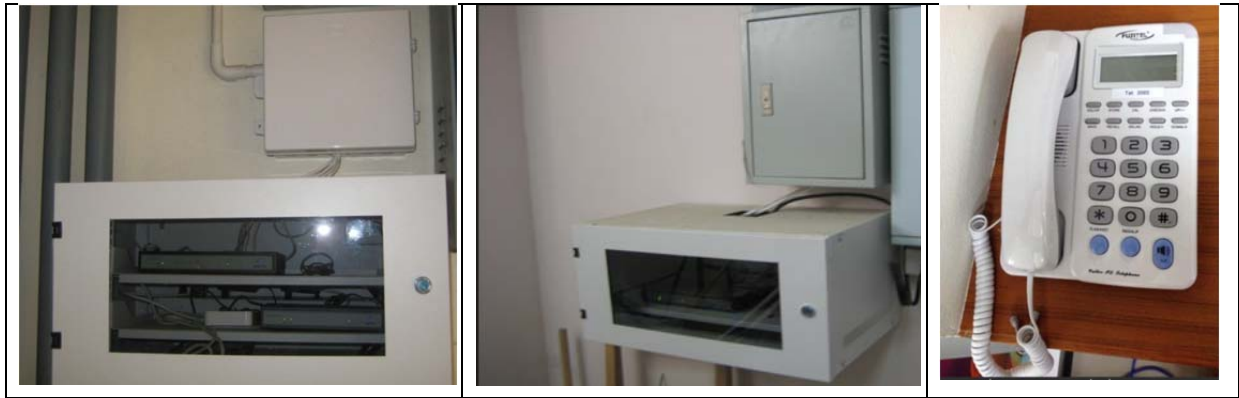
รูปที่ 3 การติดตั้งจุดใช้งาน VoIP แบบควบคุมจากศูนย์กลาง

โดยอุปกรณ์ FXS gateway ที่ใช้ในการติดตั้งในโครงการวิจัยนี้ เป็นของบริษัท Dinstar รุ่น DAG2000-4S, DAG2000-8S, DAG2000-16S, DAG2000-24S และ DAG2000-32S ซึ่งสามารถรองรับการเชื่อมต่อจุดใช้งานได้ 4, 8, 16, 24 และ 32 จุดตามลำดับ