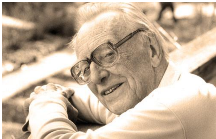
คาร์ล ออร์ฟ (Carl Orff: 1895-1982)

ดนตรีเป็นศิลปะแขนงหนึ่งที่ถูกสร้างสรรค์ขึ้นด้วยฝีมือของมนุษย์ การเล่นดนตรีคือการถ่ายทอดจินตนาการทางอารมณ์ผ่านการร้องหรือเล่นเครื่องดนตรี การสร้างงานศิลปะทุกชนิดต้องมีความประณีตงดงามและแสดงออกถึงความคิดสร้างสรรค์ วิชาดนตรีเป็นส่วนหนึ่งของการศึกษาสำหรับเด็กทุกคน เพื่อให้เด็กมีพัฒนาการด้านอารมณ์ สังคมและมีความคิดสร้างสรรค์ อันจะนำไปสู่การเจริญเติบโตเป็นบุคคลที่มีคุณภาพของสังคม วิธีการสอนดนตรีจึงควรมีลักษณะที่เปิดโอกาสให้เด็กได้ฝึกฝนทักษะดนตรี ฝึกฝนการทำงานเป็นกลุ่ม และฝึกฝนการคิดสร้างสรรค์ ซึ่งการสอนดนตรีตามแนวคิดของออร์ฟเป็นวิธีการสอนแบบหนึ่งที่สูงเสริมให้เกิดลักษณะการเรียนการสอนดังกล่าว