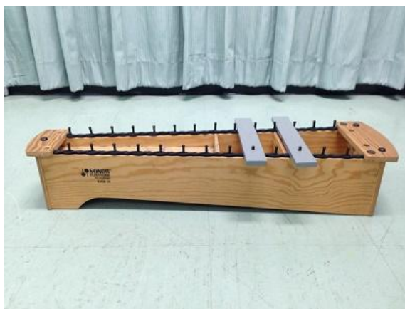
ระนาดออร์ฟที่ถอดลูกออกเหลือเพียงเสียง Sol Mi

การเล่นระนาดในเพลงนี้ครูจะถอดลูกระนาดออกให้เหลือเพียง 2 ลูก คือ เสียง Sol และ Mi เด็กๆ จะเล่นระนาดที่มีลูกระนาดเพียง 2 ลูกนี้โดยไม่พลาดไปเป็นเสียงอื่น และเป็นการช่วยลดความกังวลในการเล่นดนตรี เด็กแต่ละคนอาจตั้งทำนอง (Improvise) ขึ้นใหม่โดยใช้เสียง 2 เสียงนี้ สลับการเล่นทำนองเพลง Cuckoo Clock ของทั้งวง เด็กได้มีโอกาสเล่นดนตรีเป็นวงและเล่นเดี่ยว(Solo) ซึ่งเป็นอีกทักษะหนึ่งของการเรียนดนตรี คือการเล่นรวมวง (Ensemble) เด็กสามารถเล่นเพลงได้อย่างไพเราะตั้งแต่เริ่มต้นเรียนดนตรี เด็กจะมีความรู้สึกประสบความสำเร็จในการเล่นดนตรี ซึ่งจะเป็นการเสริมแรงให้เด็กเกิดความสุขสนทน และรักที่จะเรียนดนตรีต่อไป