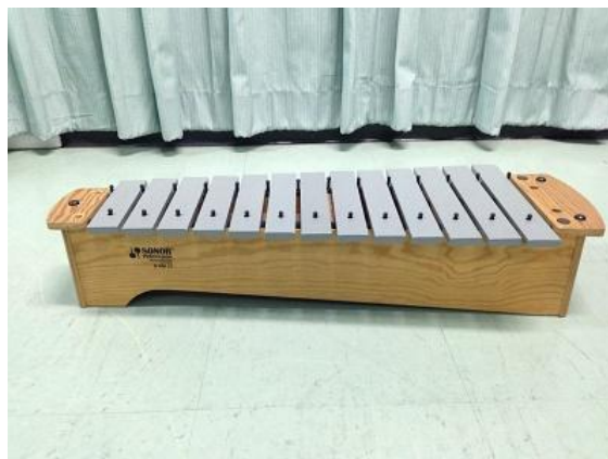
ระนาดออร์ฟที่มีลูกระนาดเต็มราง