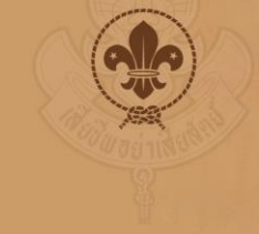
Lord Baden-Powell Chief scout of the world

ลอร์ดบาเดน เพาเวลล์ได้เขียนหนังสือ เป็นคู่มือสำหรับการฝึกอบรมลูกเสือขึ้นมาเล่มหนึ่ง มีชื่อว่า “Scouting for Boy” ซึ่งคำว่า “Scout” ที่ใช้เรียกลูกเสือมาจากคำว่า S มาจาก Sincerity หมายถึง ความจริงใจ C มาจาก Courtesy หมายถึง ความสุภาพอ่อนโยน O มาจาก Obedience หมายถึง การเชื่อฟัง U มาจาก Unity หมายถึง ความเป็นใจเดียวกัน T มาจาก Thrifty หมายถึง ความประหยัด