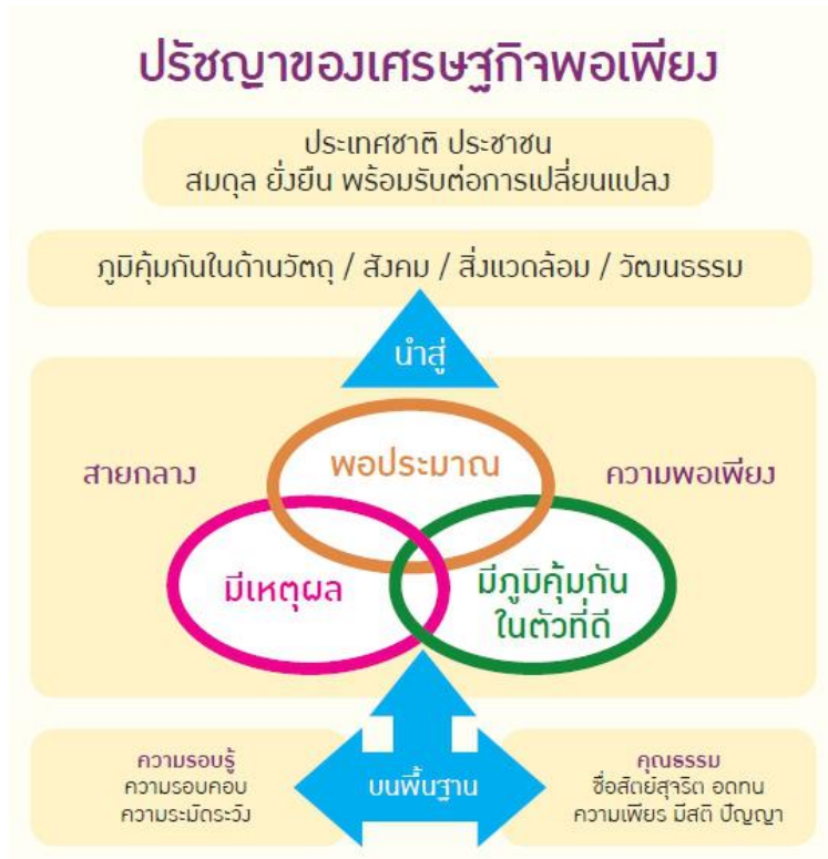
ภาพที่ ๓.๒ แนวความคิดเศรษฐกิจพอเพียง ๓ หวง ๒ เงื่อนไข ที่มา : (สำนักงานคณะกรรมการพัฒนาการเศรษฐกิจและสังคมแห่งชาติ: ๒๕๕๑)

การพัฒนาตามหลักเศรษฐกิจพอเพียง คือ การพัฒนาที่ตั้งอยู่บนฐานของทางสายกลางและความไม่ประมาท โดยคำนึงถึงความพอประมาณ ความมีเหตุผล การสร้างภูมิคุ้มกันที่ดีในตัวตลอดจนใช้ความรู้ ความรอบคอบ และคุณธรรม ประกอบการวางแผน การตัดสินใจ และการกระทำ