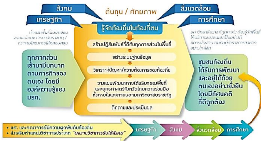
ภาพที่ ๗.๓ บูรณาการความร่วมมือกับเครือข่าย