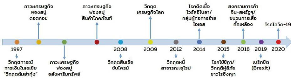
ที่มา : (สุวิทย์ เมษินทรีย์, ๒๕๖๓: ๔)

ปัจจุบันประเทศไทย กำลังเผชิญกับ “วิกฤตซ้ำซาก” ที่เกิดขึ้นระลอกแล้วระลอกเล่า ตั้งแต่ “วิกฤตต้มยำกุ้ง” ที่เริ่มต้นที่ประเทศไทย ในปี ค.ศ. ๑๙๙๗ มาจนถึง การแพร่ระบาดของโรคโควิด-๑๙ ในปี ค.ศ. ๒๐๑๙ บางวิกฤตเป็น “วิกฤตเชิงซ้อน” ที่หลายวิกฤตได้กระหน่ำซ้ำเติมในเวลาเดียวกัน อย่างไรก็ตาม อย่างไรก็ตามในประเทศไทยที่ประสบปัญหาโรคโควิด-๑๙ แล้วก็ต้องเผชิญกับปัญหาภัยแล้ง และการฟื้นฟูเศรษฐกิจหลังวิกฤตโควิดที่กำลังจะเกิดขึ้นตามมา (สุวิทย์) ดังรูป ภาพที่ ๓.๑ วิกฤตเศรษฐกิจ