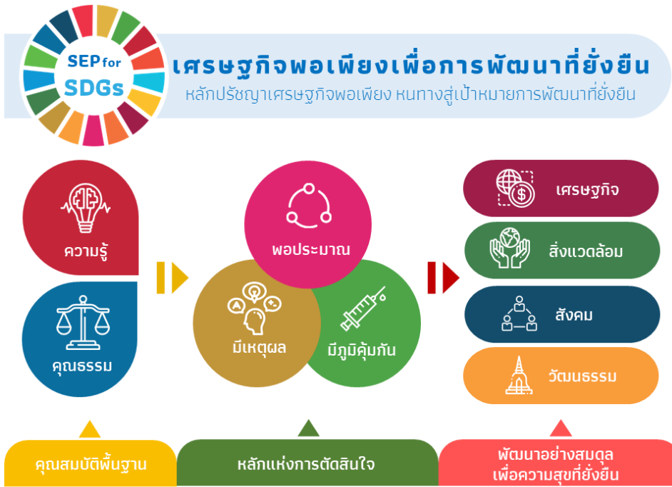
ภาพที่ ๔.๓ ปรัชญาของเศรษฐกิจพอเพียงกับเป้าหมายการพัฒนาที่ยั่งยืน

ปรัชญาของเศรษฐกิจพอเพียงและศาสตร์พระราชหรือความรู้ที่ได้จากพระราชกรณียกิจของรัชกาลที่ ๙ สามารถนำไปประยุกต์ใช้เพื่อบรรลุ SDG ทั้ง ๑๗ ประการได้ ปรัชญาของเศรษฐกิจพอเพียงเป็นแนวคิดยุทธศาสตร์ชาติ ๒๐ ปีที่พัฒนาขึ้นตามปรัชญาของเศรษฐกิจพอเพียงเพื่อถ่ายทอดแนวคิดเป็นยุทธศาสตร์ แผนพัฒนาเศรษฐกิจและสังคมแห่งชาติฉบับที่ ๑๒ การปรับปรุงกฎหมาย ๓๑๘ ฉบับ และแผนแม่บทด้านต่างๆ เป็นการนำไปสู่การปฏิบัติ โดยประยุกต์ใช้กับทุกภาคส่วนของสังคมเพื่อให้เกิดการขับเคลื่อนอย่างยั่งยืนและมั่นคง ด้านภาคชุมชนและประชาสังคม มีการติดตามไปศึกษากรณีที่ชาวบ้านนำปรัชญาของเศรษฐกิจพอเพียงไปใช้ในชีวิตและอาชีพ ด้านภาคการเกษตรได้สร้างความพออยู่พอกินให้กับชุมชนท้องถิ่นและเป็นต้นทางของการพัฒนาในทุกด้าน สร้างความมั่นคงลดรายจ่าย พึ่งตนเองได้และแก้ปัญหาความยากจนภาคครัวเรือน ด้านภาคธุรกิจได้ปรับแนวคิดมาใช้อย่างกว้างขวางทั้งธุรกิจขนาดใหญ่ขนาดกลาง และขนาดเล็ก โดยยอมรับการมีกำไรในระดับพอประมาณ และต้องไม่แสวงหากำไรโดยการเอาเปรียบผู้บริโภคหรือทำผิดกฎหมายภาคธุรกิจจำนวนมากยังได้ร่วมแสดงความรับผิดชอบต่อสังคมมากขึ้นโดยเข้ามามีส่วนร่วมในการแก้ปัญหาความยากจนและช่วยพัฒนาชนบท (คณะกรรมการโครงการเฉลิมพระเกียรติของสภานิติบัญญัติแห่งชาติ, ๒๕๖๐: ๒๙๑)