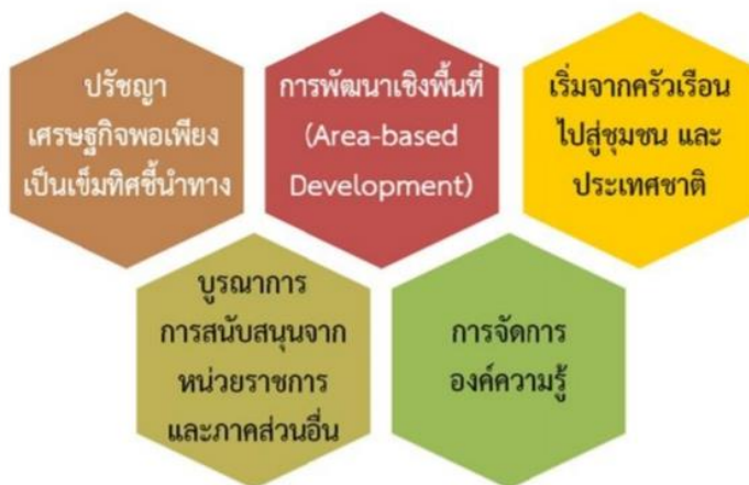
ภาพที่ แนวคิด ในการขับเคลื่อนการพัฒนา

๔ ปี เพื่อใช้ในการขับเคลื่อนการพัฒนาตามปรัชญาของเศรษฐกิจพอเพียงด้านต่างๆ ได้แก่ ด้าน การเกษตรและชนบท ด้านการศึกษา ด้านธุรกิจ บริการ การท่องเที่ยว อุตสาหกรรม และ ผู้ประกอบการรายย่อย ด้านการต่างประเทศ ด้านการประชาสัมพันธ์ รวมถึงด้านความมั่นคงเกิด การบูรณาการการปฏิบัติงานของทุกหน่วยงานให้เป็นไปในทิศทางเดียวกัน เพื่อบรรลุเป้าหมาย เดียวกันอย่างเป็นรูปธรรม โดยมีแนวคิดพื้นฐานในการขับเคลื่อนการพัฒนา ดังรูป