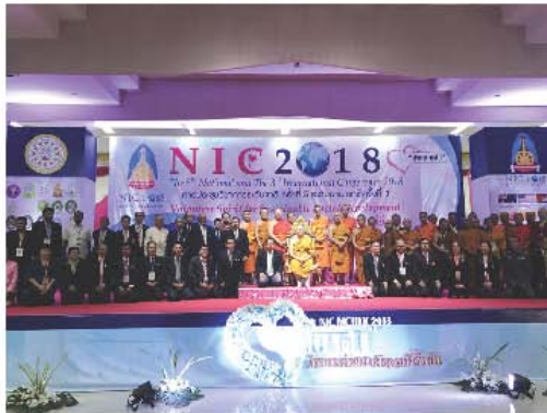
การประชุมวิชาการระดับชาติ ครั้งที่ ๕ ระดับนานาชาติ ครั้งที่ ๓ ๒๔ - ๒๕ มีนาคม พ.ศ.๒๕๖๑ ณ หอประชุมวิทยายุทธขอนแก่น ต.โคกสี อ.เมือง จ.ขอนแก่น