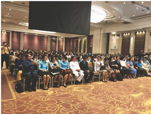
การประชุมสัมมนาพัฒนาคุณธรรมจริยธรรมกระทรวงสาธารณสุข ครั้งที่ ๑๓ ประจำปี ๒๕๖๑ ณ โรงแรมมิราเคิล แกรนด์ คอนเวนชั่น กรุงเทพมหานคร