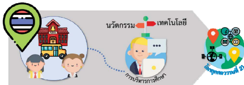
ภาพที่ 2 ความสำคัญของนวัตกรรมและเทคโนโลยีต่อการบริหารการศึกษา

จากเหตุผลที่กล่าวมาผู้เขียนสามารถสรุปความคิดเห็นออกเป็นภาพข้างต้น แสดงให้เห็นถึงความท้าทาย ที่มีผู้ต่อบริหารการศึกษา ในโลกยุคที่มีการเปลี่ยนแปลงเกิดขึ้นอย่างรวดเร็ว เนื่องจากเป้าหมายทางการศึกษาที่เปลี่ยนไป ผู้บริหารในยุคศตวรรษที่ 21 ต้องไม่ลืมนึกถึงความท้าทายในด้านต่าง ๆ อันได้แก่