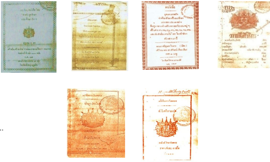
ภาพที่ ๑.๕ แบบเรียนหลวงทั้ง ๖ เล่ม

๓.๓) แบบเรียนหลวงทั้ง ๖ เล่มนี้ คือ “ต้นกำเนิดแห่งความคิด” ในการจัดทำ “หนังสือแบบเรียนภาษาไทย” ในยุคปัจจุบันซึ่งเราจะเห็นได้ว่า “หนังสือแบบหัดอ่านเบื้องต้น” ที่ใช้สืบทอดกันมาจนทุกวันนี้ทุกเล่ม ก็แต่งโดยถือแบบเรียนชุดนี้เป็นบรรทัดฐานทั้งสิ้น