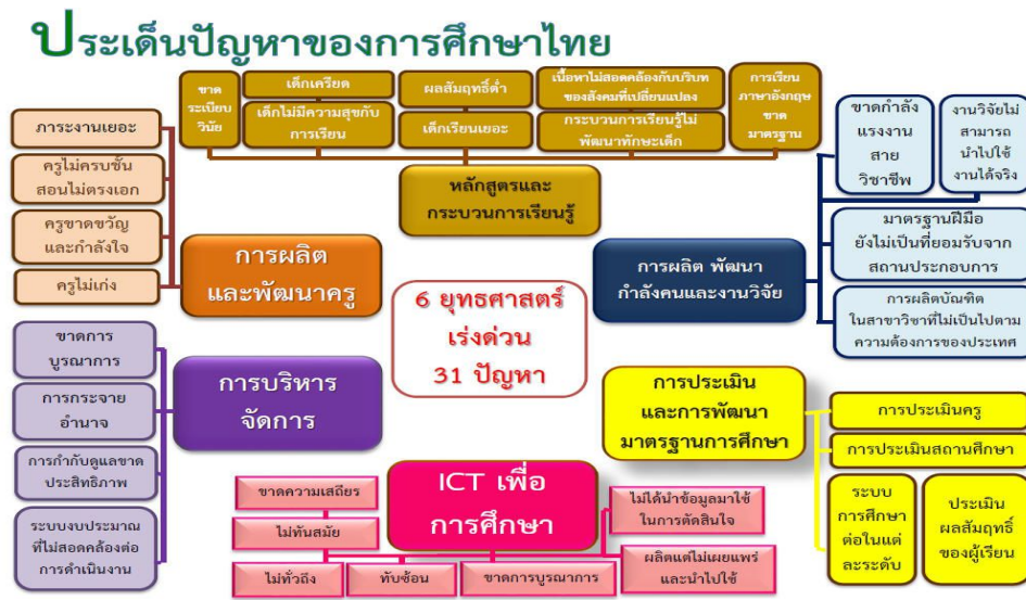
ภาพที่ ๔.๑ ปัญหาการศึกษาไทย