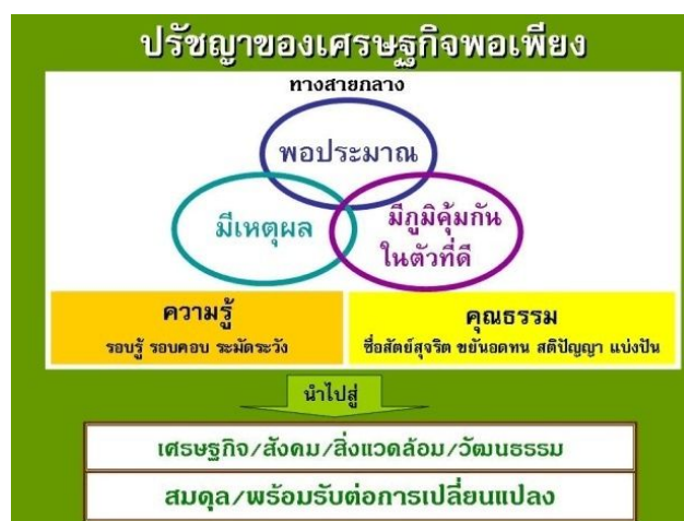
ภาพที่ ๖.๑ กรอบแนวคิดของหลักปรัชญาเศรษฐกิจพอเพียง

ดังนั้น แนวคิดของหลักปรัชญาเศรษฐกิจพอเพียง คือ การพัฒนาที่ตั้งอยู่บนพื้นฐานของทางสายกลางและความไม่ประมาท โดยคำนึงถึง ความพอประมาณ ความมีเหตุผล การสร้างภูมิคุ้มกันที่ดีในตัว ตลอดจนใช้ความรู้ความรอบคอบ และคุณธรรม ประกอบการวางแผนการตัดสินใจและการกระทำ ดังแสดงในภาพที่ ๖.๑