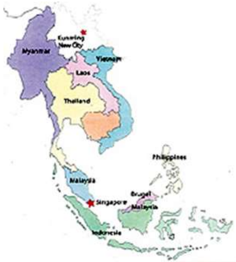
รูปภาพที่ 2 แผนที่แสดงที่ตั้งของนครคุนหมิง

เชื่อมโยงดินแดนจีนตอนใน (ไม่ติดกับประเทศอื่นๆ) กับประเทศในทวีปเอเชียตะวันออกเฉียงใต้และเอเชียใต้ เพื่อขยายความร่วมมือทางเศรษฐกิจ การค้า และการแสวงหาทางออกสู่ทะเล เป็นต้น