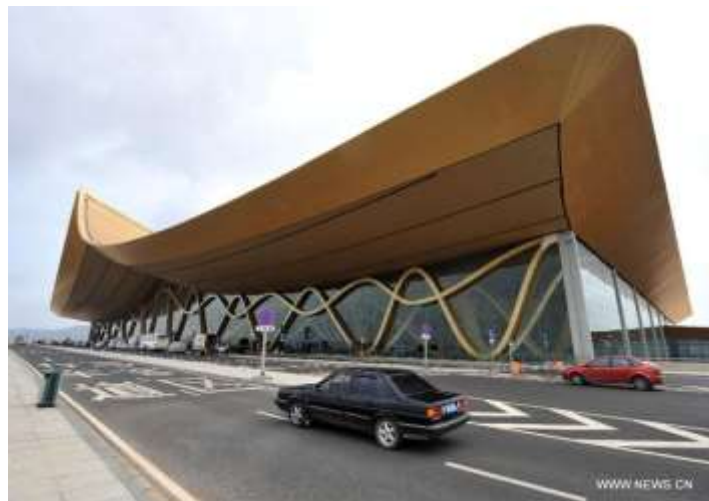
รูปภาพที่ 6 สนามบินนานาชาติฉงชู่

สนามบินฉงชู่ที่ถือว่าเป็นสนามบินอันดับ 4 ของประเทศ รองจากสนามบินปักกิ่ง เซี่ยงไฮ้ และกว่างโจว ที่สร้างขึ้นใหม่เพื่อรองรับการท่องเที่ยวจากประชาชนอาเซียนไปยังนครคุนหมิง และจากคุนหมิงบินตรงถึงเมืองสำคัญๆในอาเซียนทุกวัน รวมถึงเส้นทางธรรมชาติอย่างเช่นทางแม่น้ำ ซึ่งจีนเป็นต้นกำเนิดแม่น้ำที่ไหลผ่านประเทศในอาเซียนหลายสาย อาทิ แม่น้ำของที่ถือได้ว่าเป็นแม่น้ำนานาชาติที่ไหลผ่านตั้งแต่จีน-เมียนมาร์-ลาว-ไทย-กัมพูชา และเวียดนาม และ แม่น้ำอิระวดี ที่มีต้นกำเนิดมาจากมณฑลยูนนานไหลมาผ่านมาที่ประเทศเมียนมาร์