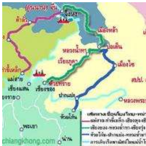
รูปภาพที่ 3 แผนที่แสดงเส้นทางการค้าจากมณฑลยูนนานสู่อาเซียน