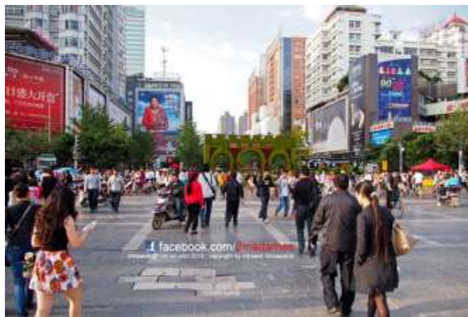
รูปภาพที่ 4 จัตุรัส Nanpingjie จุดศูนย์รวมการค้าขายของนครคุนหมิง

ในปี 2014 ที่ผ่านมานครคุนหมิงได้ถูกจัดให้เป็นเมืองที่มีการเจริญเติบโตทางเศรษฐกิจอันดับที่ 6 ของโลกจาก Global Metro Monitor เศรษฐกิจของคุนหมิงขึ้นกับสินค้าเกษตร อุตสาหกรรมเสื้อผ้า กระดาษ ปูนซีเมนต์ เครื่องจักร ยาสูบ และท่องเที่ยว การที่มีอุตสาหกรรมที่หลากหลายเพราะในคุนหมิงมีเขตอุตสาหกรรมทั้งหมด 12 เขตอุตสาหกรรม ได้แก่ Kunming National New and High-tech industrial development zone, Anning Industrial Park, Yiliang Industrial Park, Jiaozi Mountain Tourism Development Zone และ Yundian Industrial Feature Park เป็นต้น