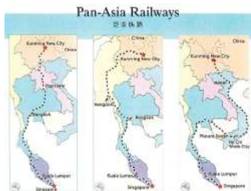
รูปภาพที่ 5 แผนภาพเส้นทาง The Pan-Asian Railway Network