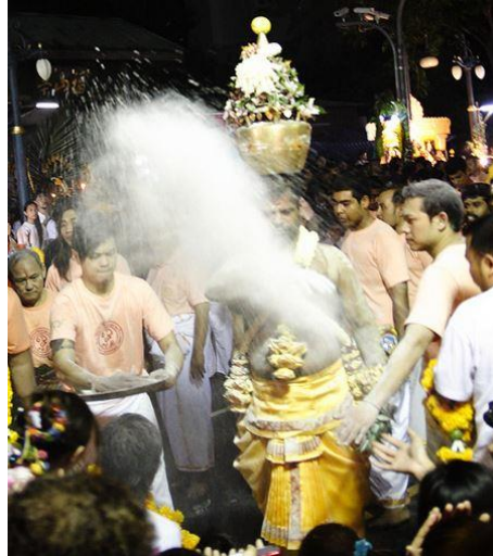
รูปภาพที่ ๑๑๑ พิธีโปรยผงเจิมศักดิ์สิทธิ์ เทศกาลนวราตรี