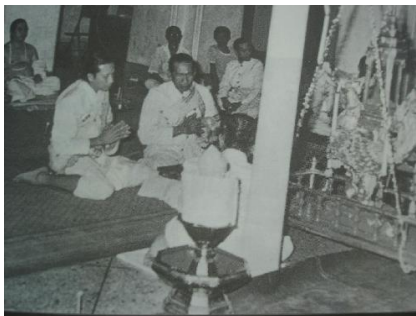
รูปภาพที่ 111 พราหมณ์กำลังประกอบพิธีชำระสิ่งในพระราชพิธีตรียัมปวาย ภายในสถานพระอิศวร