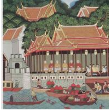
รูปภาพที่ 112 พระราชพิธีไล่เรือ