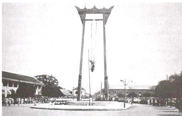
รูปภาพที่ 11 พิธีโล้ชิงช้าในอดีต

กระดานเอก มีเงินรางวัลสูงที่สุดถึง ๑๒ บาท กระดานโท ๑๐ บาท และกระดานตรี ๘ บาท ในแต่ละกระดานจะมี “นาลิวัน” ขึ้นไปโล้โลดโผนถึงครั้งละ ๔ คน รวม ๓ ชุด ๑๒ คน ส่วนเงินรางวัลจะบรรจุในถุงซึ่งแขวนอยู่บนหัวเสาไม้ที่ปักไว้ข้างเสาชิงช้า ก่อนที่ “นาลิวัน” ทั้ง ๔ คน จะขึ้นไปโล้ชิงช้า ทุกคนจะต้องนั่งลงกราบถวายบังคมพระเจ้าอยู่หัว ๓ ลา แล้วจึงสวมหัวนาคโดยสมมติว่าเป็นพญานาค เมื่อขึ้นบนแผ่นกระดานเป็นที่เรียบริ้อยแล้ว พวก “นาลิวัน” ที่อยู่เบื้องล่างจะช่วยกันดึงเชือกให้แผ่นกระดานแกว่งตัวไปมาที่ละน้อยจนแรงขึ้นสูงขึ้นทุกขณะ ส่วน “นาลิวัน” ที่ยืนอยู่บนกระดานเริ่มกระแทกน้ำหนักส่งจังหวะให้เกิดแรงเหวี่ยง จนเมื่อกระดานโยกตัวสูงขึ้นใกล้กับยอดเสาไม้ไผ่ที่ปักลงเงินรางวัล แต่มีกฎเกณฑ์ว่าห้ามใช้มือเอื้อมหยิบ ต้องใช้ปากคาบอย่างเดียว