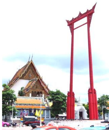
รูปแบบที่ 11 เสาชิงช้าซึ่งใช้เป็นที่ประกอบพิธีโล้ชิงช้า อันเป็นพิธีสำคัญในพระราชพิธีตรียัมปวาย

พิธี “โล้ชิงช้า” ได้เริ่มมีมาแต่ครั้งกรุงศรีอยุธยาจนถึงสมัยกรุงรัตนโกสินทร์ “เสาชิงช้า” ที่เห็นในปัจจุบันนั้นสร้างขึ้นในสมัยรัชกาลพระบาทสมเด็จพระพุทธยอดฟ้าจุฬาโลก (รัชกาลที่ ๑) เมื่อวันที่ ๘ เมษายน พ.ศ. ๒๓๒๗ มูลเหตุของการสร้างเสาชิงช้าเนื่องมาจาก มีพราหมณ์ชาวเมืองสุโขทัยผู้หนึ่งได้กราบบังคมทูลต่อพระบาทสมเด็จพระพุทธยอดฟ้าจุฬาโลกฯ ว่า ตามธรรมเนียมของการประกอบ “พิธีตรียัมปวาย” นั้นจำเป็นอย่างยิ่งที่จะต้องมีการ “โล้ชิงช้า” ด้วย แต่ด้วยความที่ขณะนั้นเป็นช่วงเวลาที่จะสร้างกรุงเทพฯ เสร็จใหม่ๆ ยังไม่มี “เสาชิงช้า” ให้ประกอบพิธี พระองค์จึงทรงโปรดฯ ให้สร้างเสาชิงช้าขึ้นในบริเวณที่ดินหน้าวัดสุทัศน์เทพวรารามในปัจจุบัน ซึ่งแต่เดิมที่ดินในบริเวณนี้เป็นเพียงป่ารก ยังไม่มีผู้คนอาศัยอยู่มากนัก