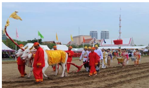
รูปภาพที่ 11 พระราชพิธีพืชมงคลจรดพระนังคัลแรกนาขวัญ

สมัยกรุงรัตนโกสินทร์ได้มีการประกอบพระราชพิธีนี้มาตั้งแต่สมัยรัชกาลที่ ๑ แต่ผู้ทำการแรกนาเปลี่ยนเป็นเจ้าพระยาพหลเทพคู่กันกับการยี่นชิงช้า แต่พอถึงรัชกาลที่ ๓ ให้ถือว่าผู้ยี่นชิงช้าผู้นั้นเป็นผู้แรกนาด้วย ในสมัยรัชกาลที่ ๔ ได้ทรงโปรดเกล้าฯ ให้จัดมีพิธีสงฆ์เพิ่มขึ้นในพระราชพิธีต่างๆ ทุกพิธี ดังนั้น พระราชพิธีพืชมงคลจึงได้เริ่มมีขึ้นแต่บัดนั้นมา โดยได้จัดรวมกับพระราชพิธีจรดพระนังคัลแรกนาขวัญ และมีชื่อเรียกรวมกันว่า พระราชพิธีพืชมงคลจรดพระนังคัลแรกนาขวัญ