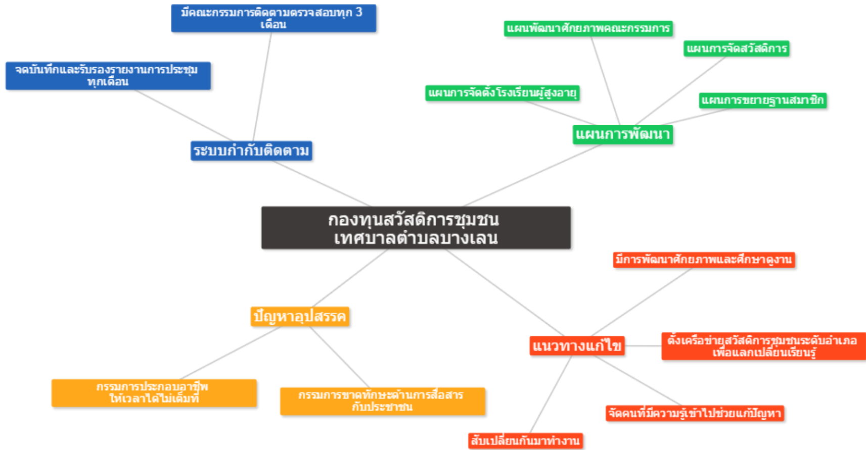
ภาพที่ 1.3 แผนภาพแสดงแนวทางบริหารจัดการกองทุนสวัสดิการชุมชนเทศบาลตำบลบางเลน พ.ศ. 2558